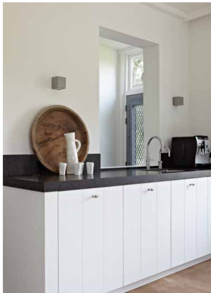
LINKS Doorkijk vanuit de entree naar de zitzkamer. RECHTS In de keukenmuur is een opening aangebracht waardoor een doorkijkje is ontstaan naar de hal, eetkamer en werkkamer. De originele voordeur is behouden.