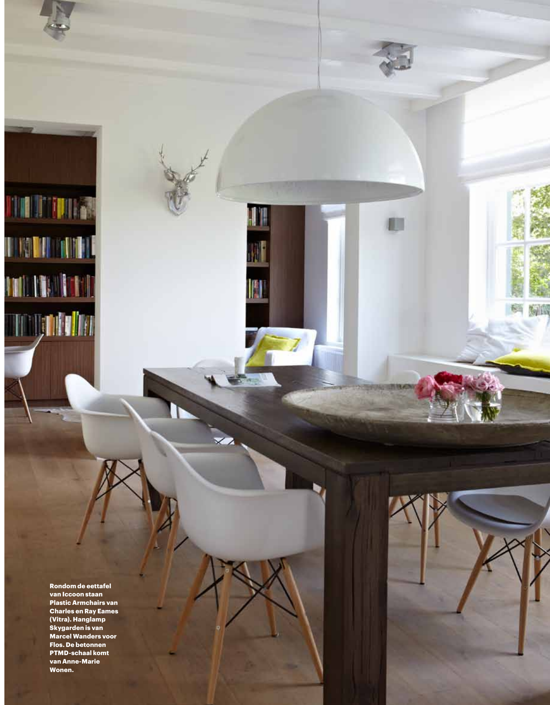
Rondom de eettafel van Iccoon staan Plastic Armchairs van Charles en Ray Eames (Vitra). Hanglamp Skygarden is van Marcel Wanders voor Flos. De betonnen PTMD-schaal komt van Anne-Marie Wonen.

Bijkomend voordeel is dat sommige ruimtes nu groter lijken. Zo voelt de relatief kleine keuken als een heuse woonkeuken. »