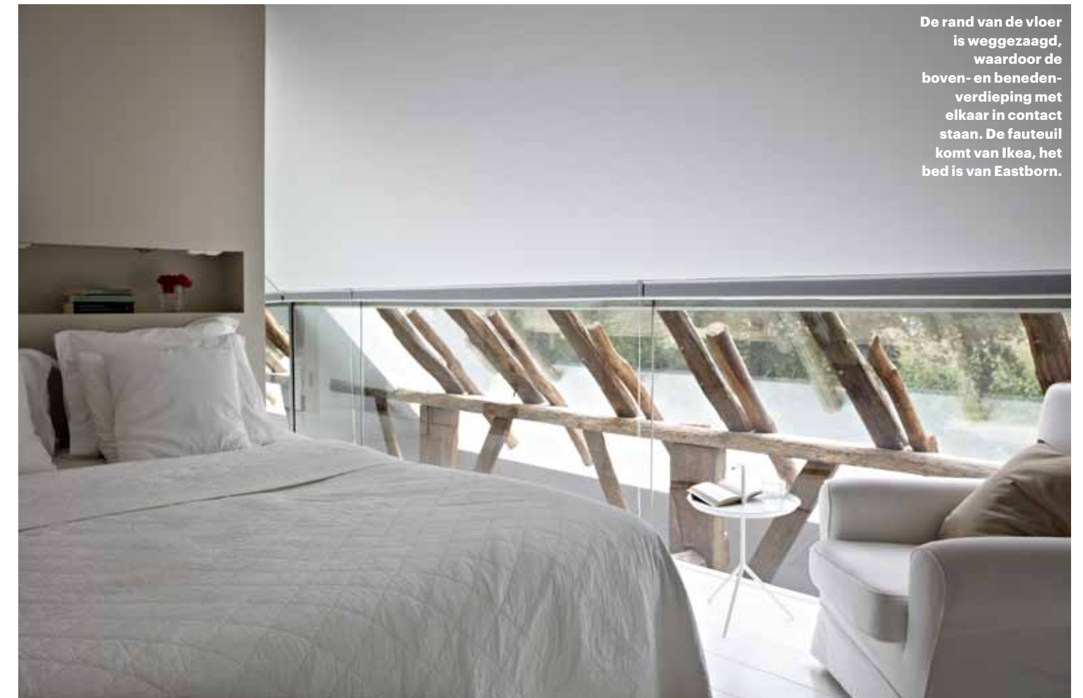
De rand van de vloer is weggezaagd, waardoor de boven- en benedenverdieping met elkaar in contact staan. De fauteuil komt van Ikea, het bed is van Eastborn.