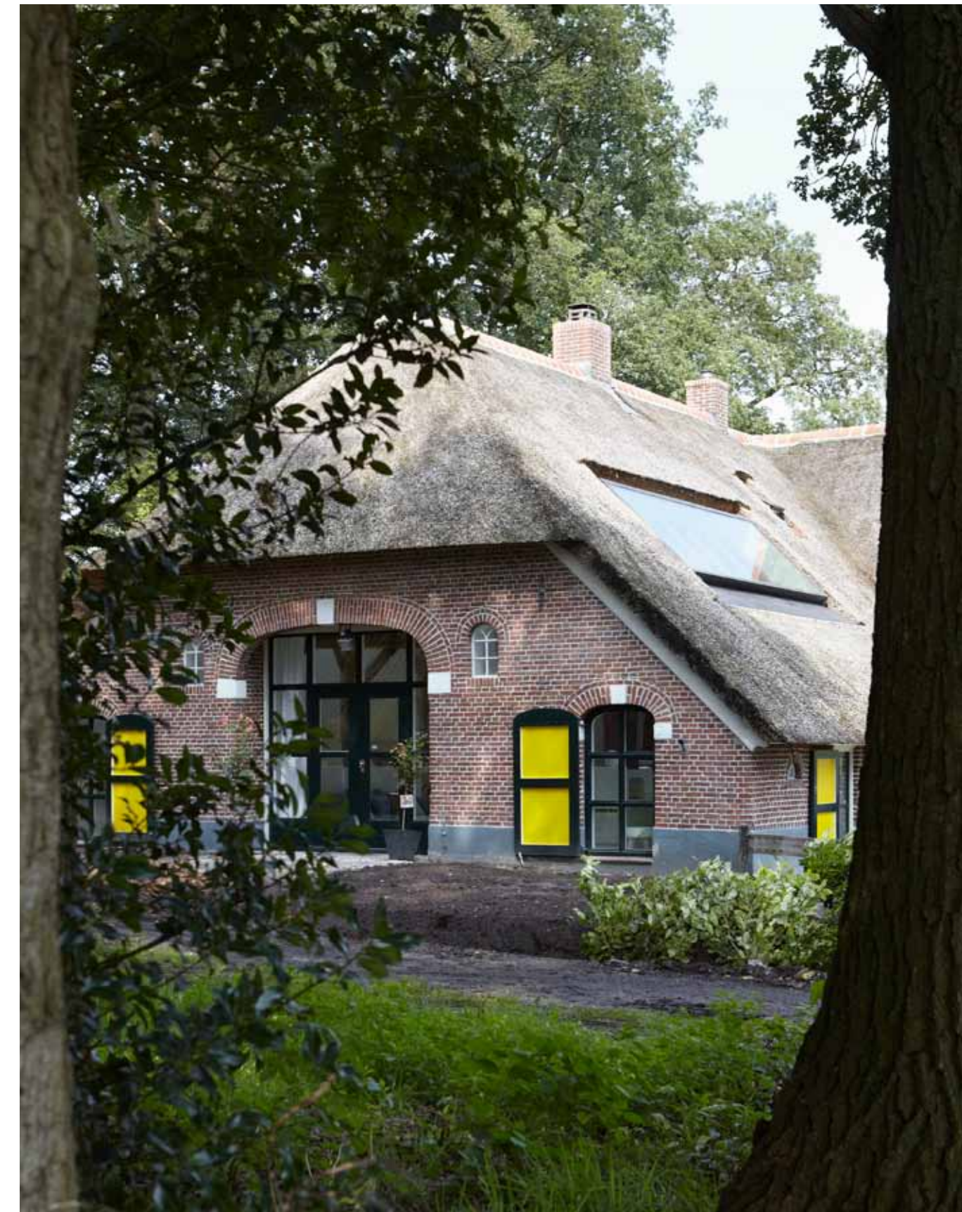
‘Gele luiken, rieten dak. Het plaatje alleen was voldoende’